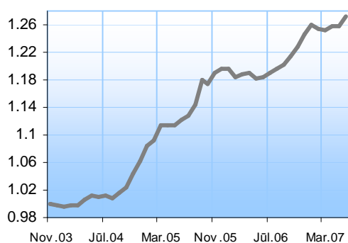
IP GAUJA daļas vērtība