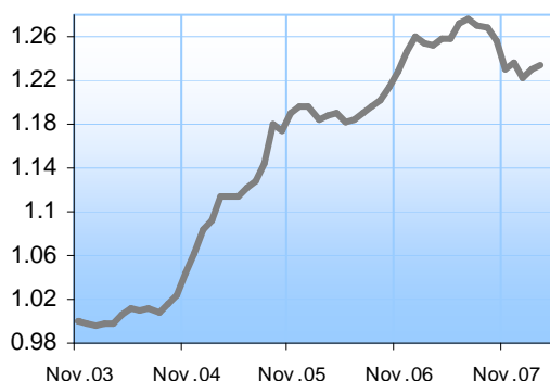
IP GAUJA daļas vērtība