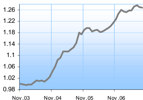
IP GAUJA daļas vērtība